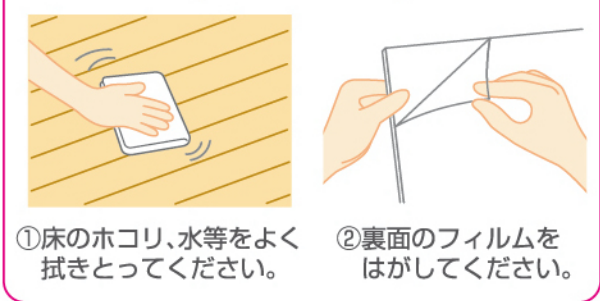
①床のホコリ、水等をよく拭きとってください。 ②裏面のフィルムをはがしてください。