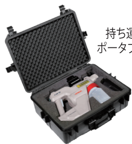
持ち運びに便利な ポータブルケース付き