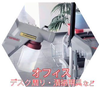
オフィス デスク周り・清掃用具など