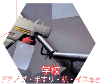
学校 ドアノブ・手すり・机・イスなど