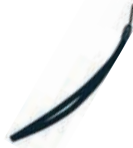
ハンドストラップ