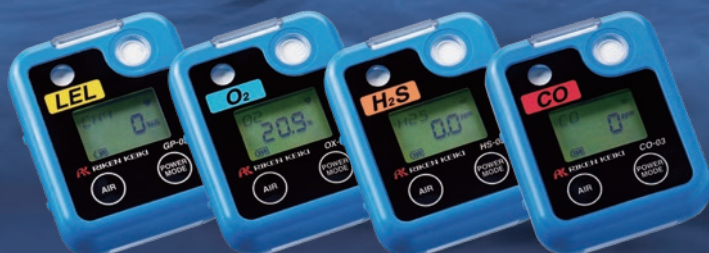
Model GP-03 可燃性ガス用