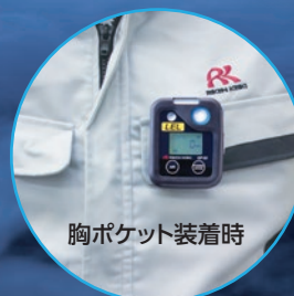
胸ポケット装着時