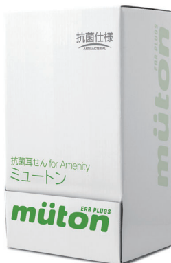
200袋入り箱 (高さ約280mm×幅約165mm×奥行約113mm)