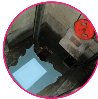
エレベーターピット