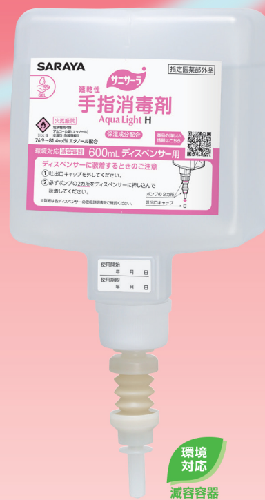
600mLディスペンサー用