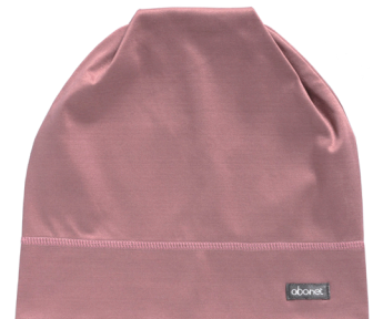
スモーキーピンク