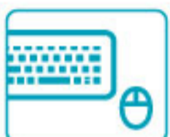
キーボード・マウス