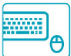
キーボード・マウス