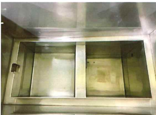
メンテナンスしやすい洗浄槽

従来のペーパー洗浄装置は、洗浄装置と冷水機が必要でしたが、本機ではペルチエ素子を加熱と冷却に使用することで冷水機が不要となりました。