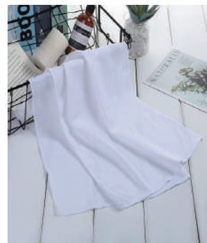
K-011 : ホワイト JAN4580512700057