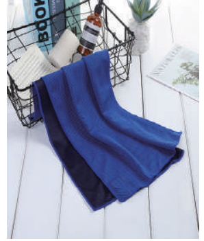
K-007 : ブルー JAN4580512700019