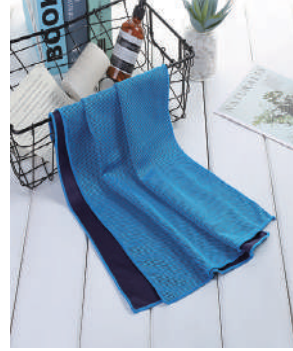
K-008 : ライトブルー JAN4580512700026