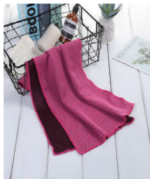
K-010 : パーラーレッド JAN4580512700040