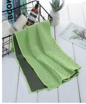
K-009 : ライトグリーン JAN4580512700033