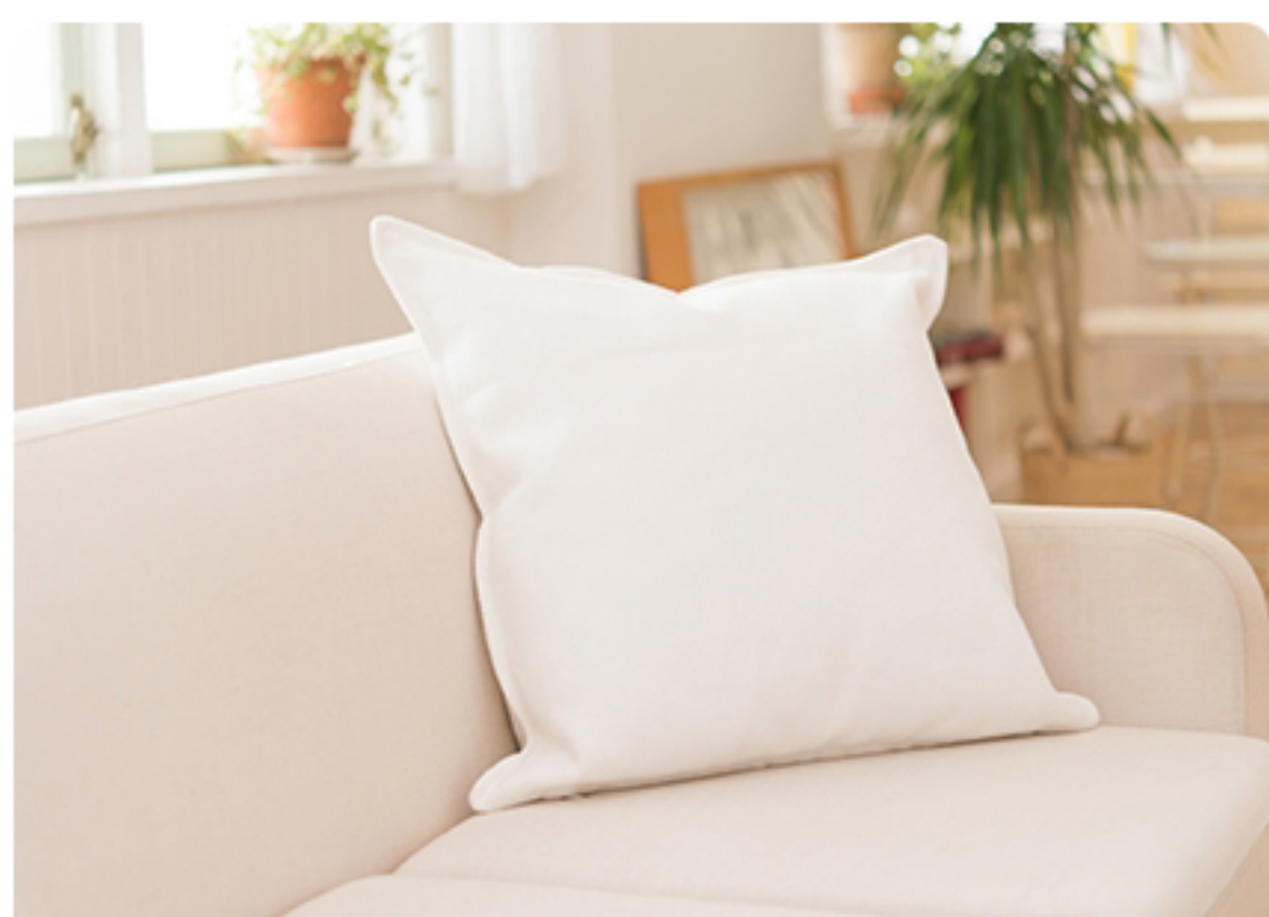
洗えない布製品の消臭・除菌