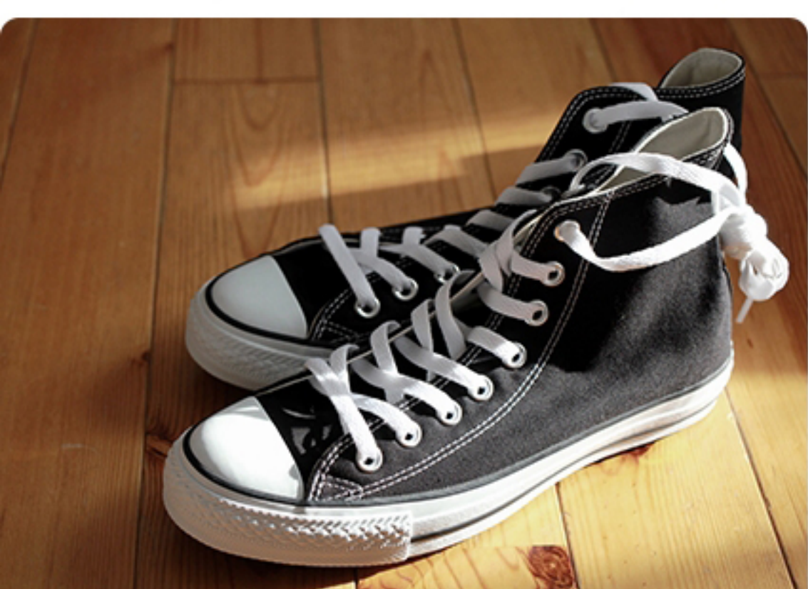
スニーカーの消臭・除菌