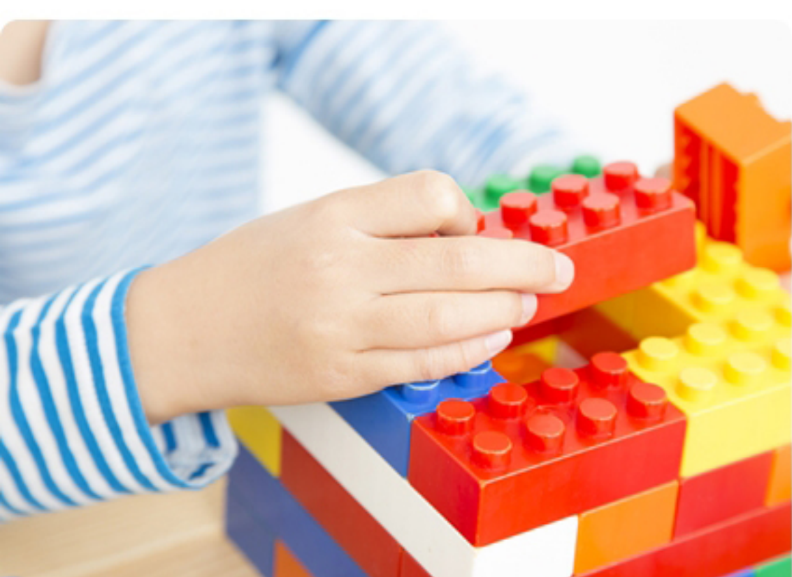
お子様のおもちゃの除菌