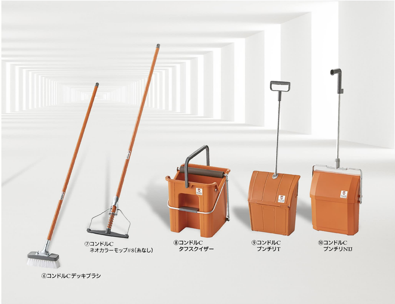
⑥コンドルCデッキブラシ