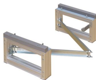
② ブレースがまっすぐになるまで広げます。