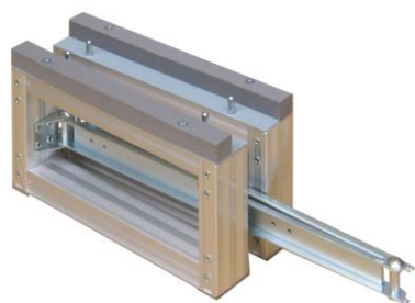
① 枠のストッパーをはずします。