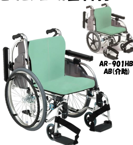
AR-901 HB-AB (自走)