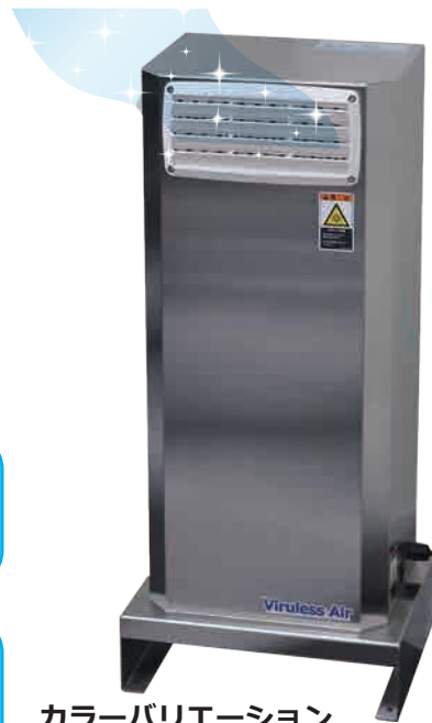
カラーバリエーション

Viruless Air は取り入れた室内の空気を紫外線ランプ (UV-C) で除菌します。