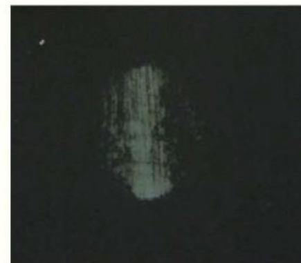
一般樹脂ワックス