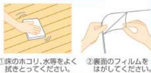
①床のホコリ、水等をよく拭きとってください。 ②裏面のフィルムをはがしてください。