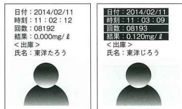
写真付き検査結果出力