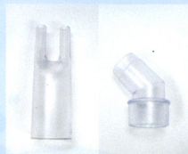
●ノーズピース2000 (L字アダプタ付)