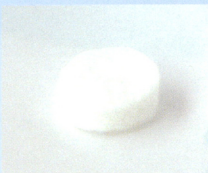
●フェルトフィルター