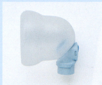
●パーフェクタ (スパーサーマスク)