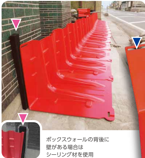
ボックスウォールの背後に壁がある場合はシーリング材を使用