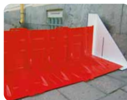
▲サイドアタッチメント