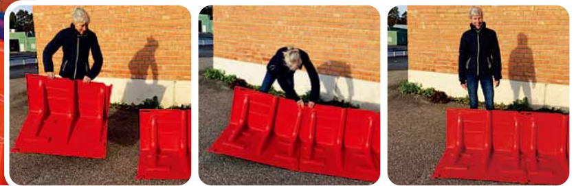
▲設置は、ボックスウォールを背後から見て左から右に並べる

Boxwallは特殊な工具やスキルを必要とせずに設置ができ、ユニットのジョイント部(▼印)をつなぐことができます。各ジョイント部は±3度の調節ができ、カーブした設置場所でも対応可能です。