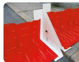
▲段差対応アタッチメント