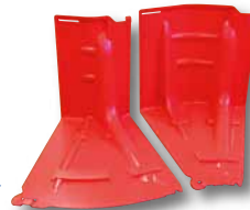
アウトコーナー(左)インコーナー(右)▶