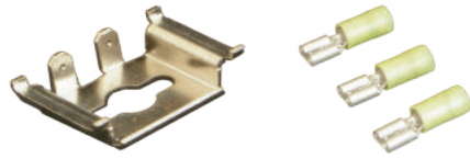
固定用金具 (1個) 接地用圧着端子 (3個)