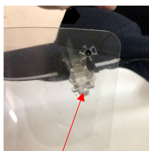
下側の取り付け穴