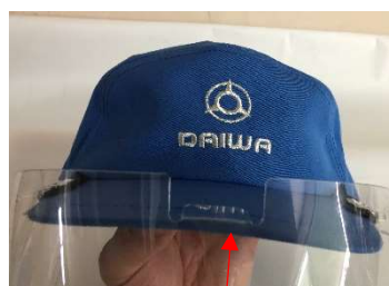
帽子のツバが水平