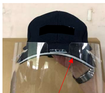
帽子のツバが湾曲