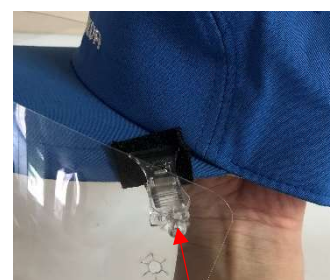
上側の取り付け穴

⑤帽子からフェイスシールドを取り外し保管するときは、紛失防止のためパッキンを挟み込んだまま保管して下さい。