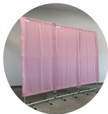
ファスナーを閉めて、 ご利用ください。