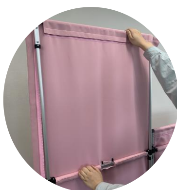
スクリーン上部を伸ばします。