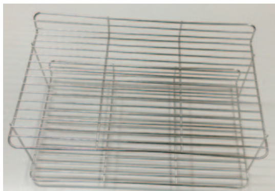
棚2段一体金網棚 × 1個