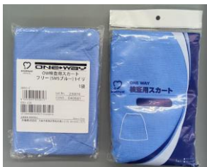
OW 検査用スカートフリー 1 枚