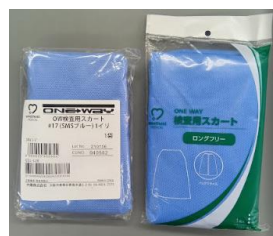
OW 検査用スカート#17 ロング 1 枚