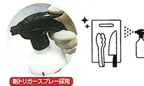
新トリガースプレー採用

毎日たくさん使うからこそ、効率的に。 1度で広範囲に噴霧でき、手への負担も少ない。 ※4,5