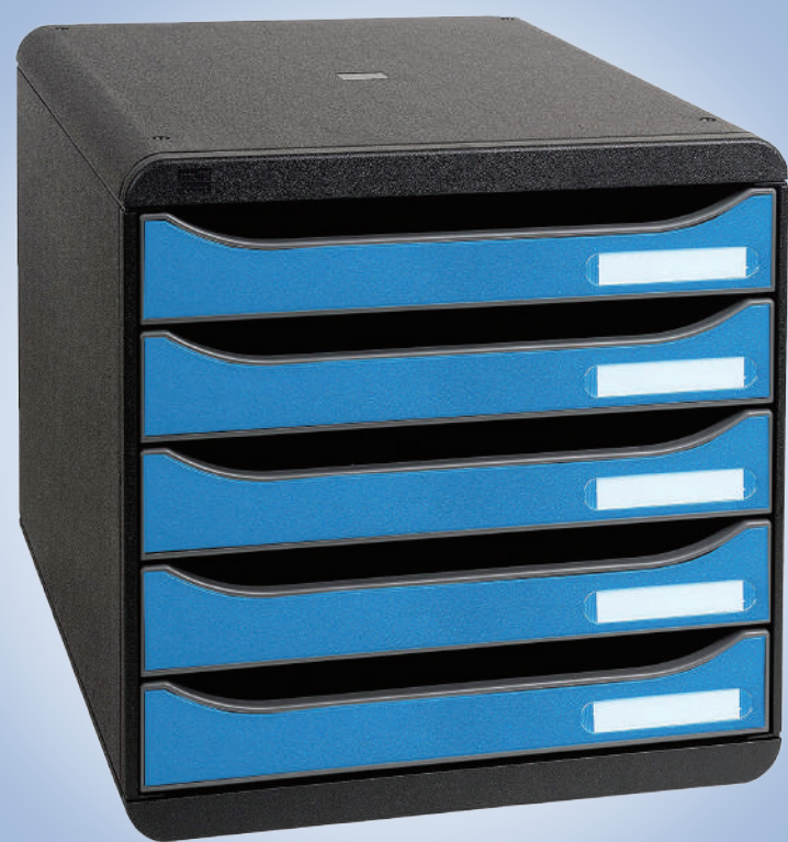
MTF3097100D レターケース BIG BOX PLUS