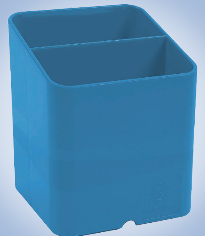
MTF677100D ペン立て PEN CUBE