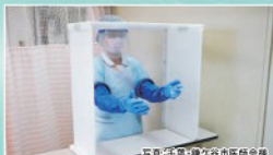
※1・飛沫感染防止用医師会標

使用イメージ(オプション付き) オプションとして上部パネル6,600円(税込)で追加いただけます。