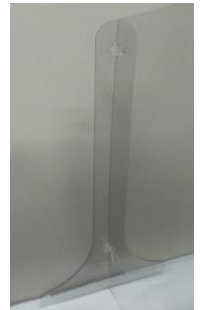
◎フロントパネルとサイドパネルのセット