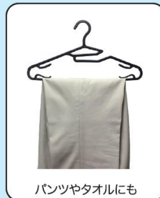
パンツやタオルにも