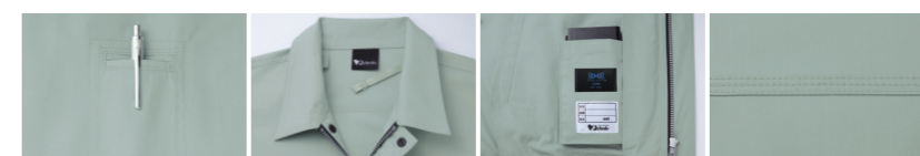
01 左袖ペン差し 02 調整紐(首元) 03 左内側 バッテリー専用ポケット 04 トリプルステッチ