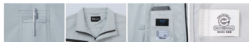
01 左袖ペン差し 02 調整紐(首元) 03 左内側 バッテリー専用ポケット 04 エコマーク