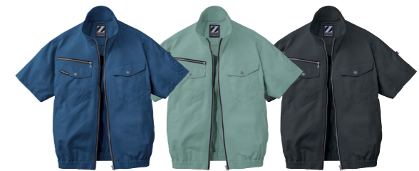
ネイビー (C/011) アースグリーン (C/039) シックブラック (C/131)