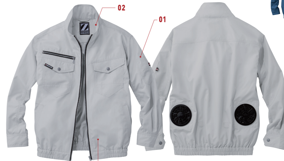
03 シルバー (C/036)