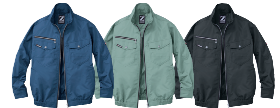
ネイビー (C/011) アースグリーン (C/039) シックブラック (C/131)