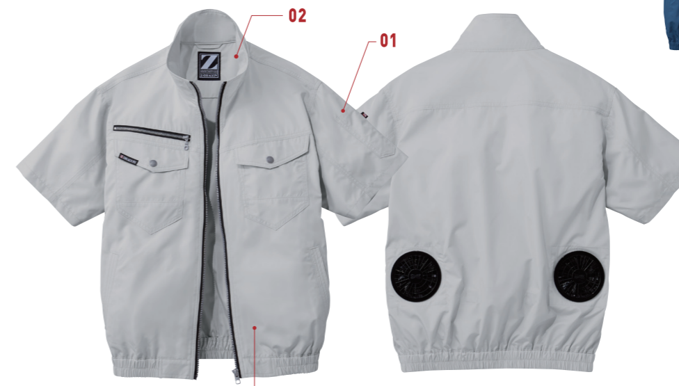
03 シルバー (C/036)