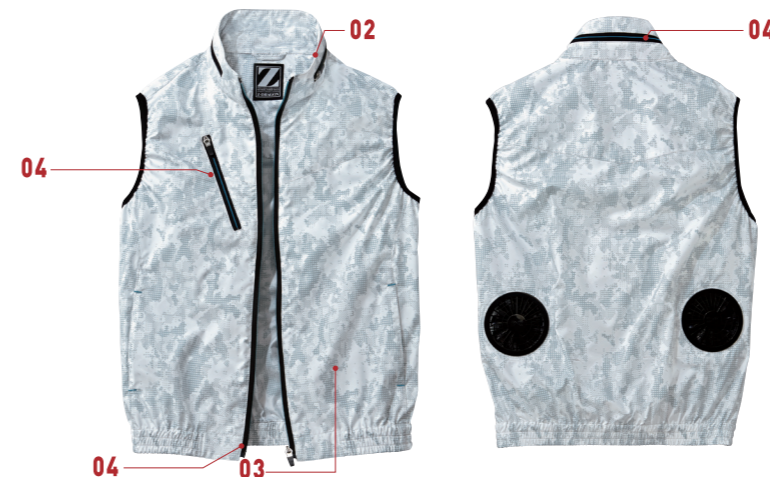
シルバーカモフラ (C/141)