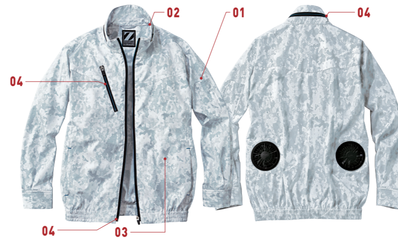
シルバーカモフラ (C/141)