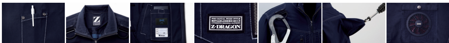
01 左袖ベン差し 02 調整紐(首元) 03 左内側バッテリー専用ポケット 04 革ラベル(人工皮革) 05 ランヤードフックかけDカン 06 ランヤード取付口 07 ファン脱落防止用メッシュ