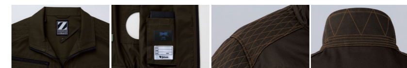
01 調整紐(首元) 02 左内側バッテリー専用ポケット 03 刺し子 04 衿裏飾りステッチ