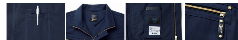
01 左袖ベン差し 02 調整紐(首元) 03 左内側 バッテリー専用ポケット 04 オリジナルスライダー