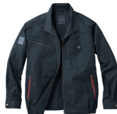
チャコールグレー (C/048)