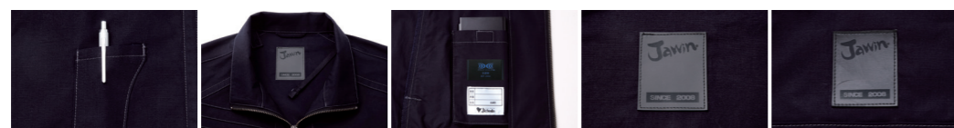
01 左袖ベン差し 02 調整紐(首元) 03 左内側 バッテリー専用ポケット 04 ワッペン(背当て) 05 ワッペン(右袖)