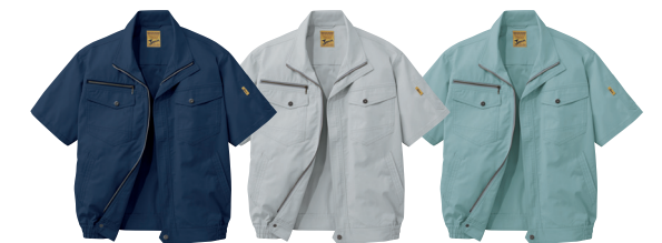
ネイビー (C/011) シルバー (C/036) アースグリーン (C/039)