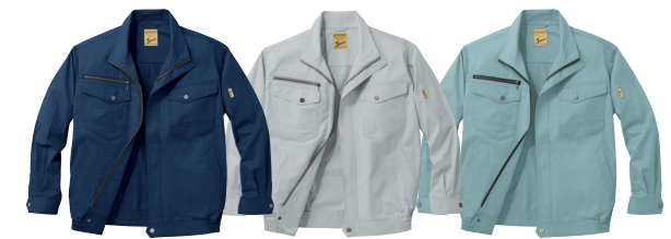
ネイビー (C/011) シルバー (C/036) アースグリーン (C/039)