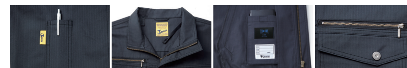
01 左袖ベン差し 02 調整紐(首元) 03 左内側バッテリー専用ポケット 04 右胸ファスナーポケット