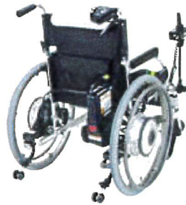
※ニッケル水素バッテリー