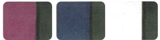
パープル(KC-JWX-1PU) ネイビー(KC-JWX-1DB) ライトグレー(KC-JWX-1LG)