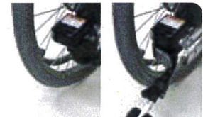
収納の状態 出ている状態