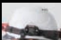
ヘルメットバンド装着時 ※ベルトクリップ装着