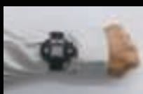
腕装着時(腕時計型) ※時計ベルト装着