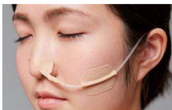
マーゲンチューブの固定に