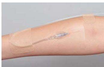
末梢静脈カテーテルの固定に