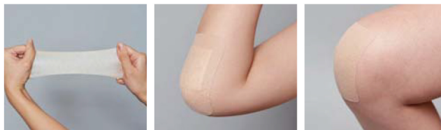
あらゆる方向にテープが伸縮、皮膚のどんな動きにも追従

柔軟性のある基材を採用しているため、あらゆる方向にテープが伸縮し、皮膚のどんな動きにも追従します。それにより、皮膚へのストレスを軽減します。