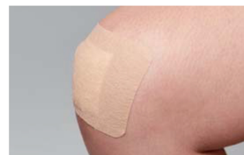
屈曲部位のガーゼ固定に