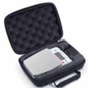
(プレミアムパック)