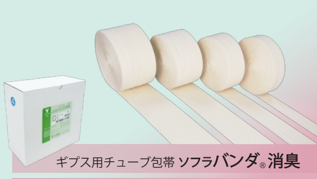
ギプス用チューブ包帯 ソフラバンダ® 消臭