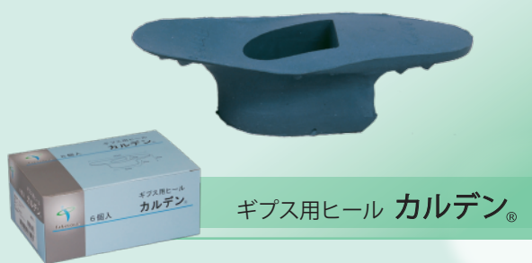
ギプス用ヒール カルデン®