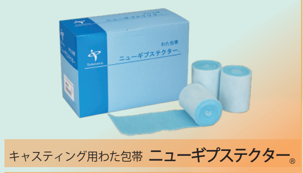
キャスト用わた包帯 ニューギプステクター®