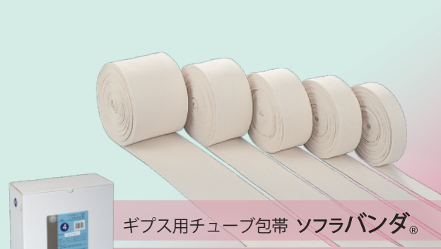
ギプス用チューブ包帯 ソフラバンダ® PE