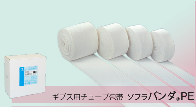
ギプス用チューブ包帯 ソフラバンダ® PE