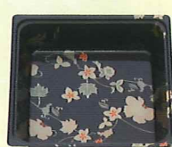
50-50 段B はなふさ