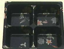
55-55 段A はなふさ