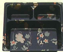
55-55 段B はなふさ