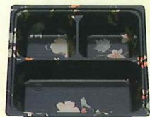
50-50 段A はなふさ