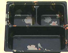
50-50 段A はなふさ