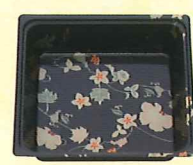
45-45 段A はなふさ