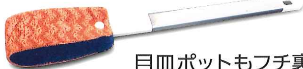
目皿ポットもフチ裏も