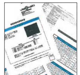
※各種検査機関資料データ

除菌一番の持つ高い除菌効力により、庫内の全てを除菌します。高い殺菌力は設置直後から効果があらわれます。 ※あらゆるウイルスに効果のあるデータが各種検査機関よりでております。