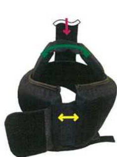
後頭部(黄)で「頭囲」を調節