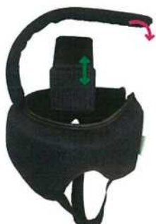
頭頂部(赤)と側頭部(緑)で「かぶりの深さ」を調節