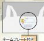
ネームプレート付き