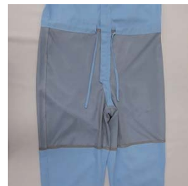
ウエスト紐仕様 吸汗メッシュ仕様