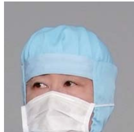
額部分にニットを仕様でフィット感あり