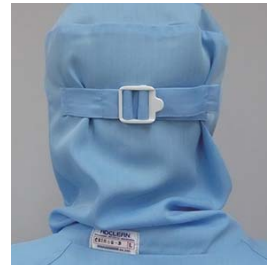
後頭部調整アジャスター付