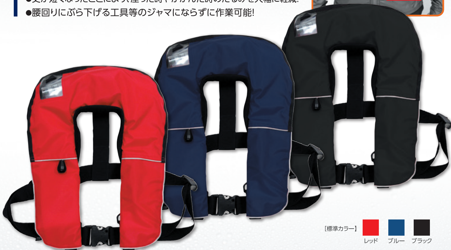
[標準カラー] レッド ブルー ブラック