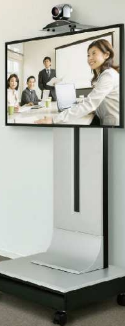
■77V型ディスプレイ / PH-915 + PHP-9102