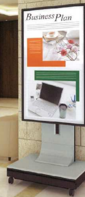
■60V型ディスプレイ / PH-917